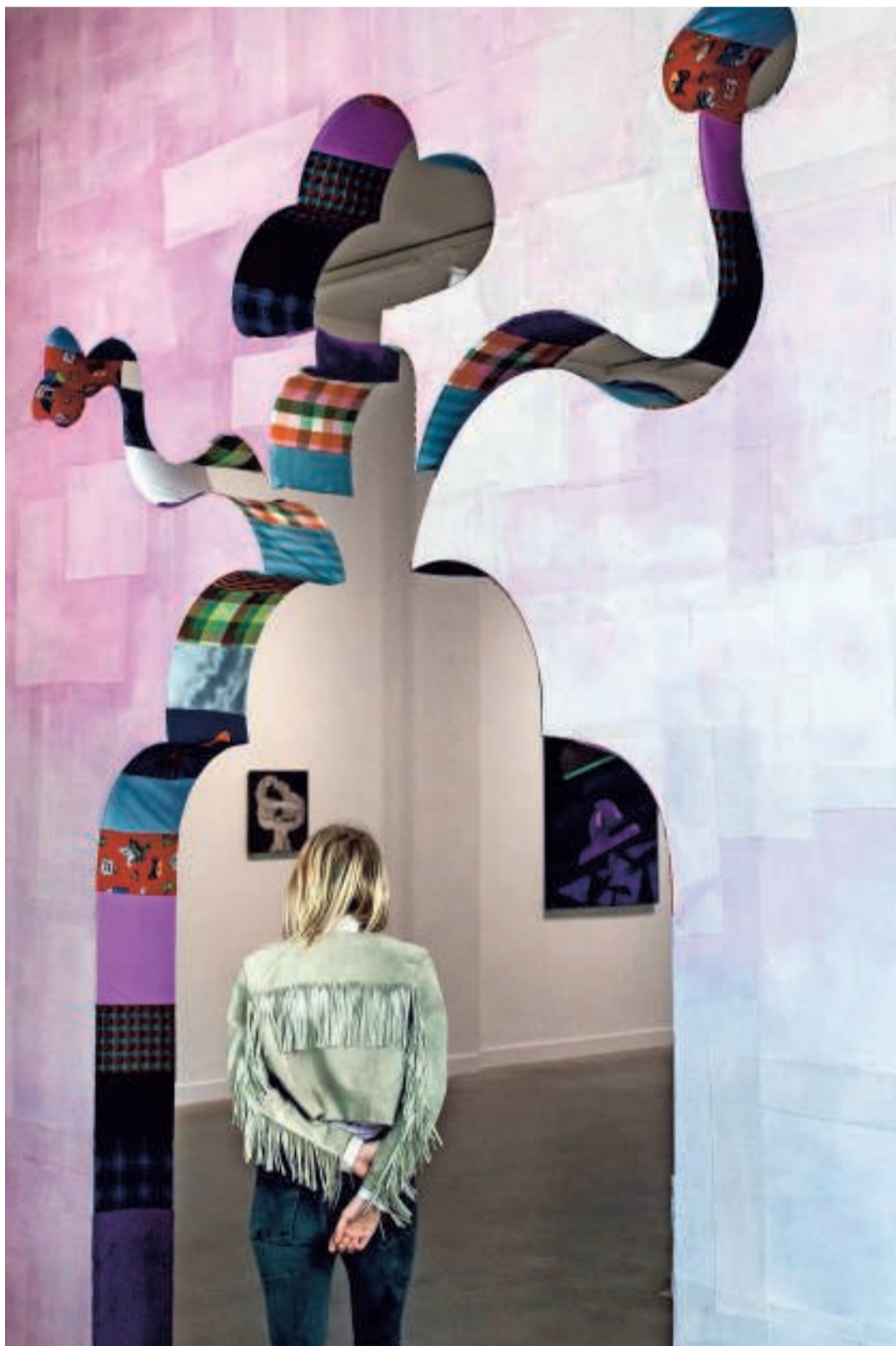
De slangenbezweerder wacht je op aan de ingang van de expo.

Als bezoeker kan je op verschillende manieren naar 'The Waddle Show' kijken. Je overziet het geheel met de kronkelende slang centraal in de zaal. Charmant, denk je. Ontwapenend ook. Bijna kinderlijk - in de goede betekenis van het woord - maar wel knap in elkaar gezet. De stapelsculpturen sporen perfect met de beeldtaal van de schilderijen. Het tegendeel zou verba-