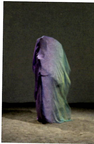
'Medusa', 2019. Steen, doek, 2 ventilators, stalen constructie, 185 x 65 x 55 cm.