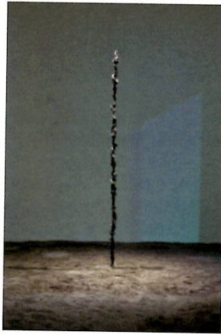
'Column', 2018. Brons, 245 x 9 x 8 cm.