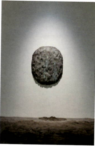
'Fountain', 2017. Brons, water, 115 x 91 x 12 cm.